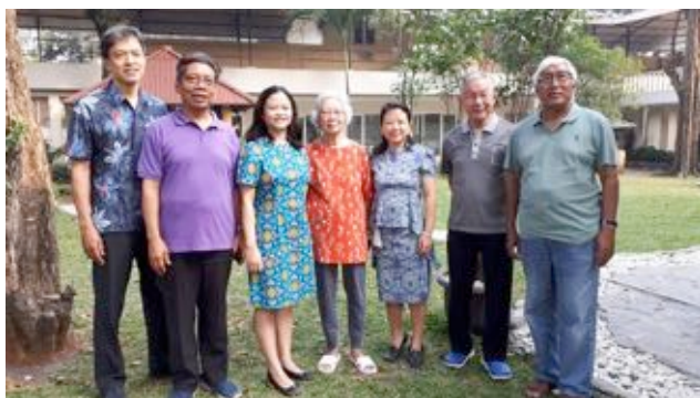
Les formateurs de l'Indonésie

En mai 2018, sept personnes ont commencé la formation pour devenir accompagnateur en relation d'aide PRH: 3 d'Indonésie (Jakarta), 2 vivant à Singapore, une personne d'origine Espagnol vivant à Cambodge et une personne de Malaisie.