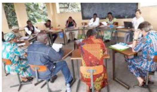
Reunión con los colaboradores